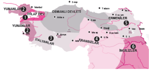
Sevr Antlaşması'na Göre İtilaf Devletlerinin Toprak Paylaşımı