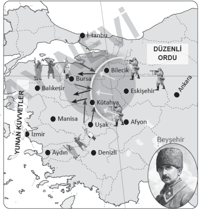
I. İnönü Savaşı Haritası ve İsmet İnönü