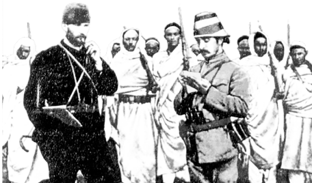
Trablusgarp Savaşı'nda Mustafa Kemal