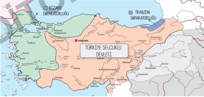
Türkiye Selçuklu Devleti (1077 – 1308)