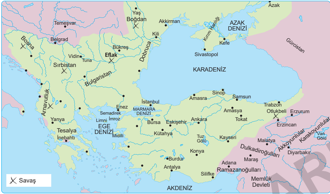
Fatih ve II. Bayezid Dönemi Osmanlı Devleti