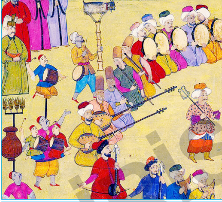
Panayır ve Şenlikler

Osmanlı panayır ve şenliklerinde ülkenin çeşitli bölgelerinden gelenler hem ürünlerini satarlar hem de bir arada dayanışma kültürünü yaşatırlardı. Meddah, orta oyunu, Karagöz, havai fişek, hokkabazlık, cambazlık oyunlarında gösteriler yapılırdı.