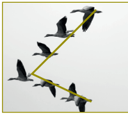
"V" şeklinde uçan göçmen kuşlar

Metne göre uçuş esnasında daha az güç tüketen kuşlar, V şeklinde uçan göçmen kuşlardır. Bu şekilde uçan kuşları gösteren görsel de C seçeneğinde verilmiştir.